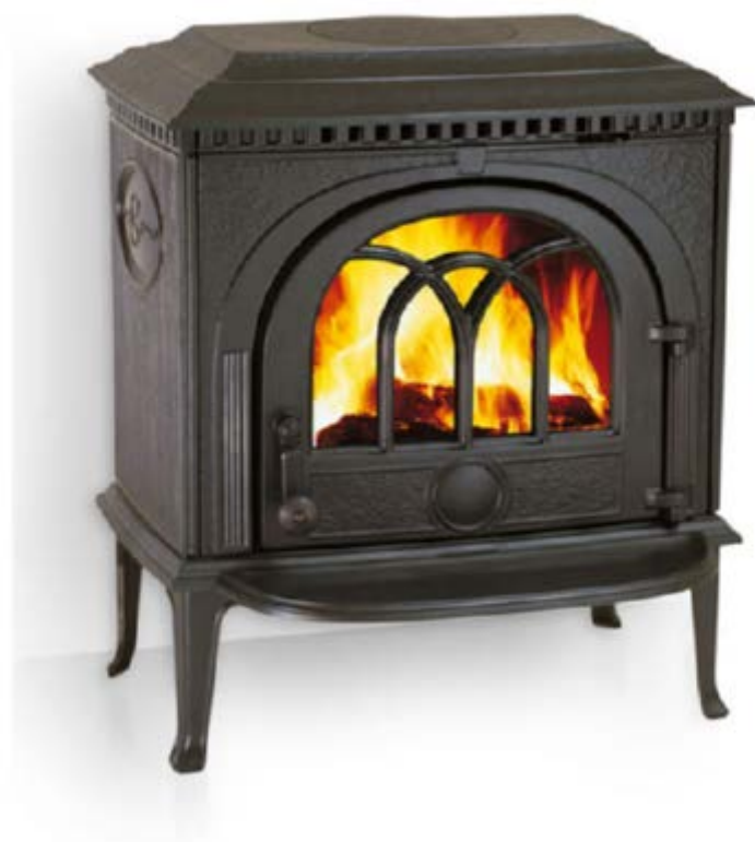
F8 TD ВР, печь Jotul